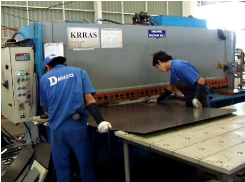
2 units of 100 tons Hydraulic shearing machine