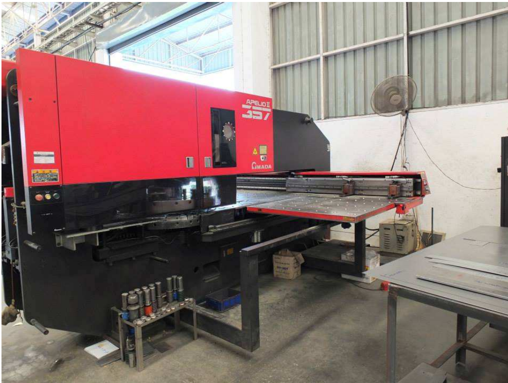
2 units of CNC. Turret punching machine.