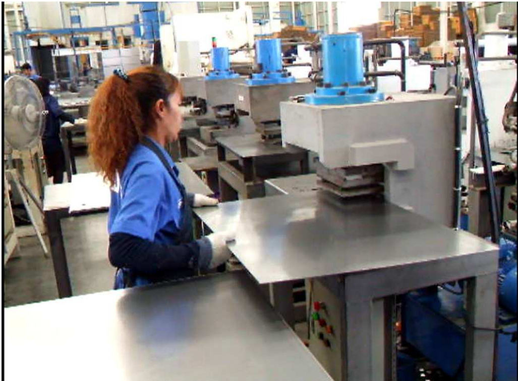
50 units of 25 tons Hydraulic press machine