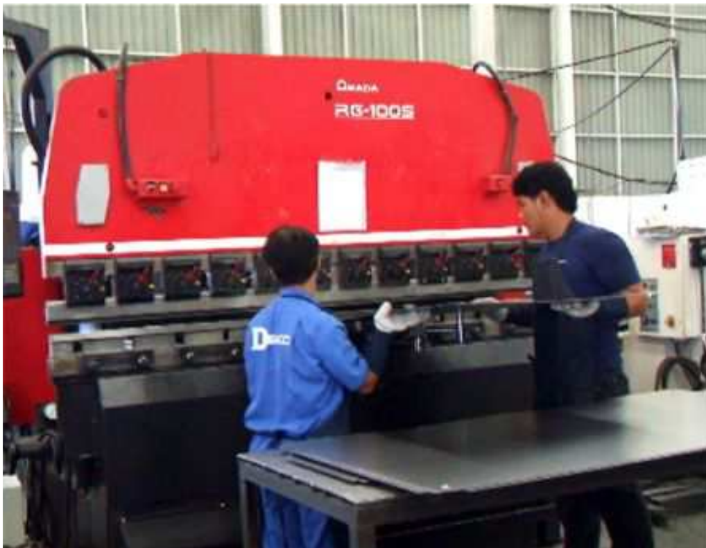
5 units of CNC. Hydraulic press break machine.