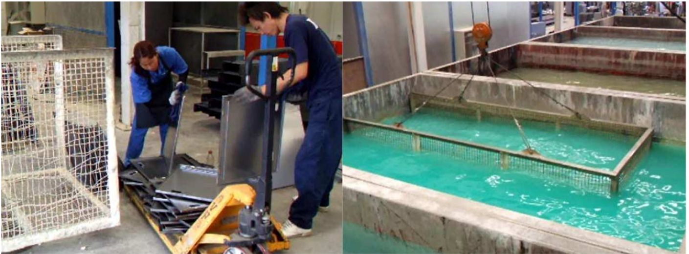
Pretreatment process plant: Completed Zinc phosphate process full function.