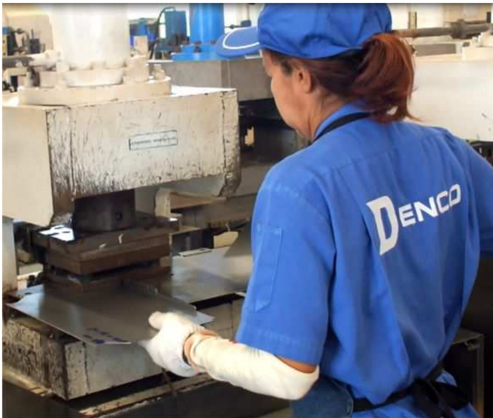
20 units of 50 tons Hydraulic press machine