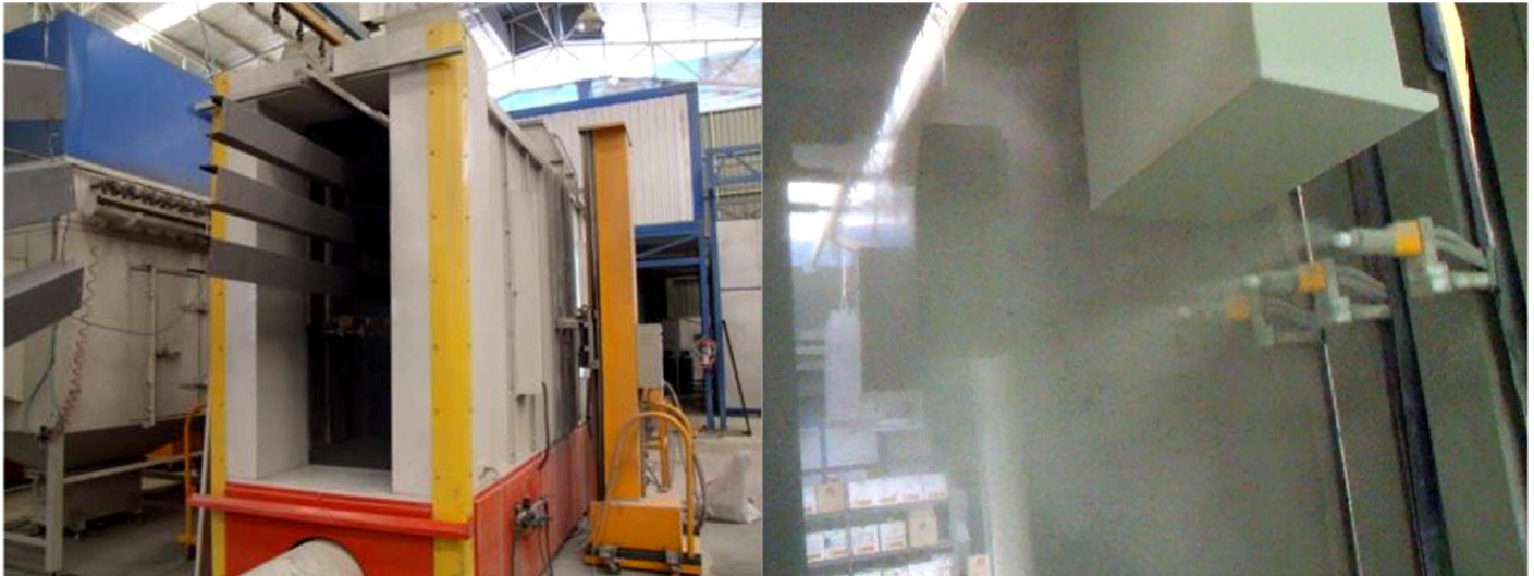
Electro static powder coating plant