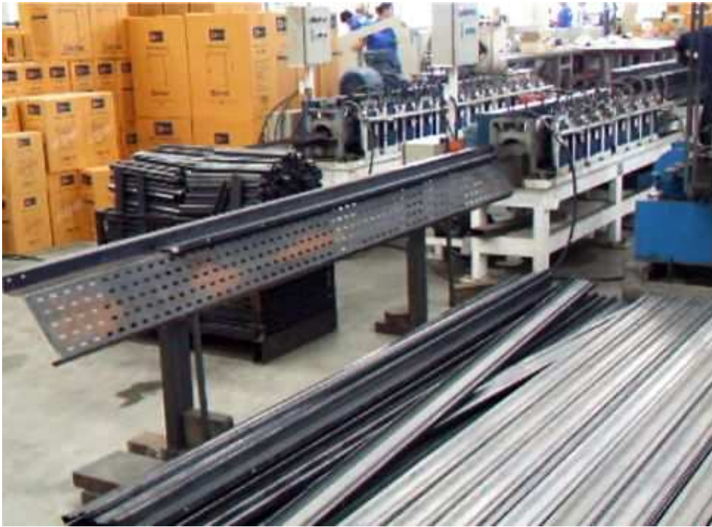
2 process line of roll forming machine.